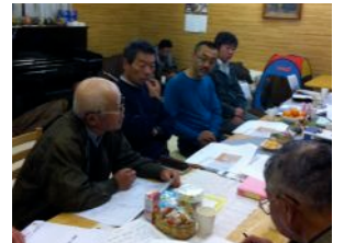
地区町内会長への説明会