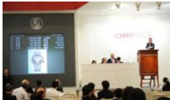
香港クリスティーズでの F.P. ジュルヌ の競売